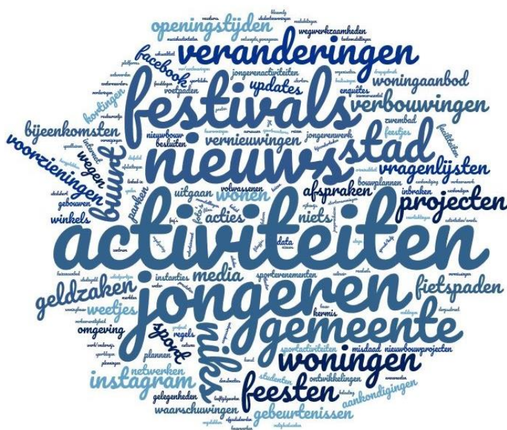
Figuur 4: Welke informatie van de gemeente zou je via sociale netwerken willen zien? (vraag 122). Minimum 1 keer genoemd, maximum 75 keer genoemd. Voor een overzicht van de open antwoorden zie bijlage 4, vraag 121.

Vervolgens is gevraagd welke informatie respondenten via sociale netwerken zouden willen ontvangen. De meest genoemde informatie is informatie over activiteiten, evenementen, jongeren, nieuws, festivals, de gemeente en de stad.