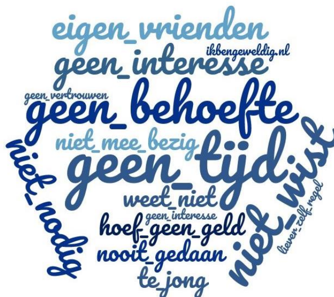
Figuur 6: Heb je wel eens overwogen om activiteiten te organiseren en daarvoor subsidie aan te vragen bij Jongeren in actie? Nee, omdat: Minimum 1 keer genoemd, maximum 16 keer genoemd. Voor een overzicht van de open antwoorden zie bijlage 4, vraag 125.

Een groot aantal jongeren kende Jongeren in actie voor het onderzoek niet. Nu ze door het onderzoek weten dat het er is, denkt 28% er zeker (3%) of misschien (25%) gebruik van te zullen maken als ze een activiteit willen organiseren voor jongeren. Dit is lager dan in 2012 en 2014 maar ongeveer gelijk aan 2014. Ten aanzien van 2016 kan niet gesteld worden dat het lager is. 9