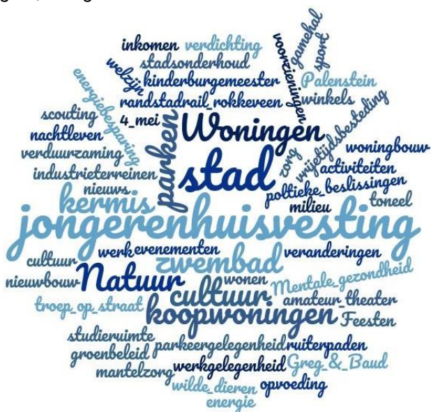
Figuur 6: Over welke onderwerpen zou je willen meepraten? Anders, namelijk: Minimum 1 keer genoemd, maximum 8 keer genoemd. Voor een overzicht van de open antwoorden zie bijlage 4, vraag 129.

Aan de respondenten die meepraten over onderwerpen die hen raken belangrijk of zeer belangrijk vinden is ook gevraagd op welke manier ze in gesprek met de gemeente willen. Het belangrijkste kanaal is e-mail, door meer dan een derde (35%) van de respondenten genoemd die meepraten belangrijk of zeer belangrijk vinden. Op de tweede plaats komen bijeenkomsten (18%) en op de derde plaats school (14%). Daarna volgen Instagram en Facebook met respectievelijk 6% en 3%. Ten opzichte van 2016 wil een hoger percentage