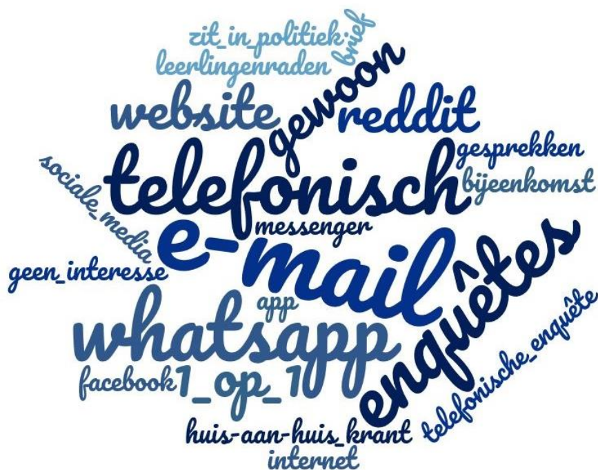
Figuur 7: Op wat voor manier zou je in gesprek willen met de gemeente? Anders, namelijk: Minimum 1 keer genoemd, maximum 6 keer genoemd. Voor een overzicht van de open antwoorden zie bijlage 4, vraag 130.

Bij 'anders, namelijk:' zijn combinaties van onderstaande antwoordcategorieën, enquêtes zoals deze, en persoonlijke gesprekken diverse keren genoemd.