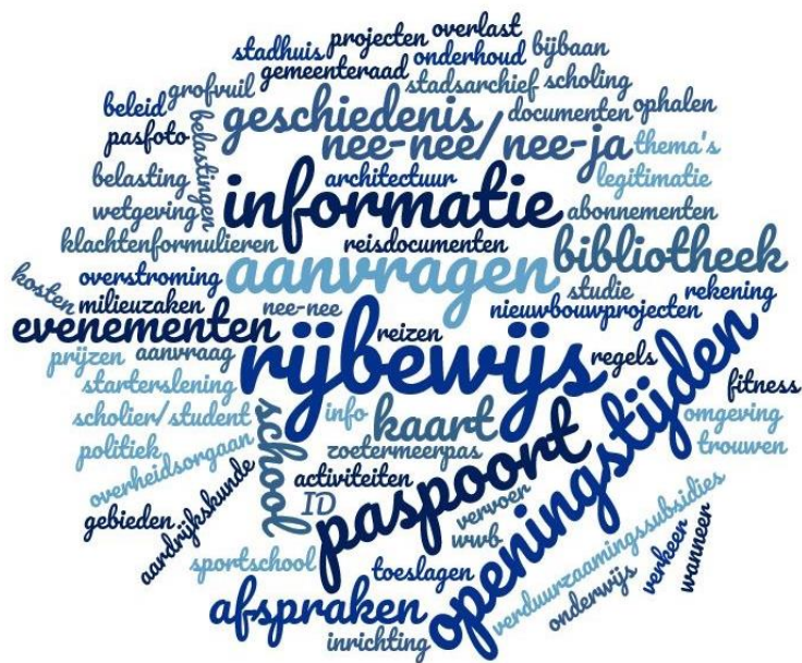
Figuur 1: Naar welke informatie ben je dan op zoek? (vraag 118) Minimum 1 keer genoemd, maximum 11 keer genoemd. Voor open antwoorden zie bijlage 4, vraag 118.

Van de respondenten zoekt 83% informatie via de website van de gemeente Zoetermeer. Dit is meer dan in 2016. Daarnaast zoekt 60% van de respondenten via een zoekmachine zoals bv. Google naar deze informatie; ongeveer hetzelfde als in 2016 4 . De Facebookpagina van de gemeente wordt door 13% geraadpleegd; ongeveer hetzelfde als in 2016. 4 6% zoekt naar informatie in de huis-aan-huisbladen; ongeveer gelijk aan 2016 4 . 5% zoekt informatie via Instagram. Dit is een toename ten opzichte van 2016; ongeveer gelijk aan 2016 4 . De respondenten zoeken het minst naar informatie over Zoetermeer via Snapchat, LinkedIn en Twitter.